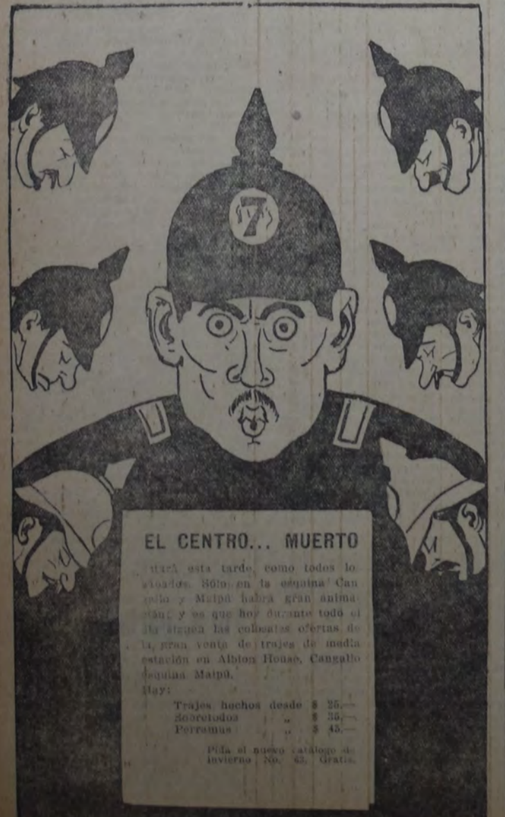
EL CENTRO... MUERTO

HAMBURGO, 17 — Stresseman, al pronunciar un discurso en el Overseas Club, demostró que la interdependencia en la economía política mundial crece cada día más.